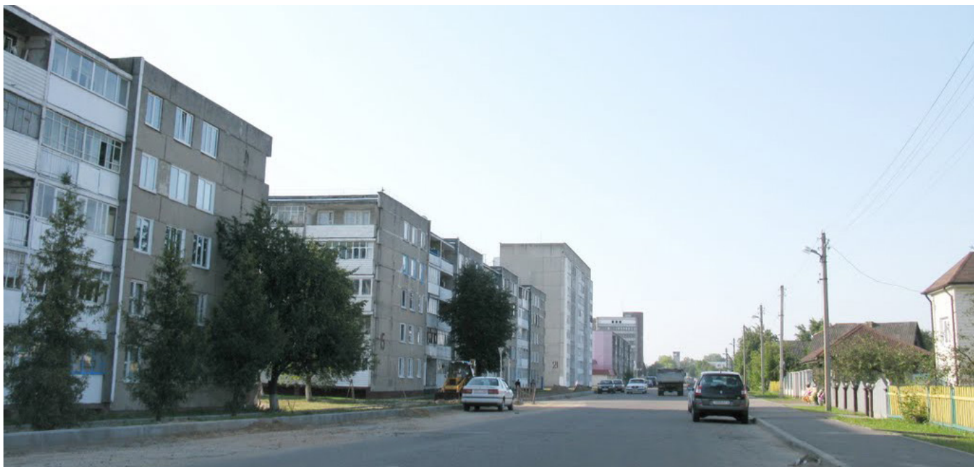
Улица Кутузова, г. Сморгонь, Гродненская обл.

Для каждого из нас Родина начинается с семьи, родного дома, улицы на которой живешь, города, в котором родился и вырос. Именно там закладывается характер человека и его судьба. Любовь к своей малой родине каждый из нас пронесет через всю жизнь. По инициативе первичной организации РОО «Белая Русь», редакционной коллегии газеты «Водоворот событий» и первичной профсоюзной организации студентов объявлен конкурс «С чего начинается Родина» на лучшие работы: литературное произведение, фотокомпозицию и видеоролик. Мы приглашаем к участию в этом конкурсе студентов, преподавателей и сотрудников университета.