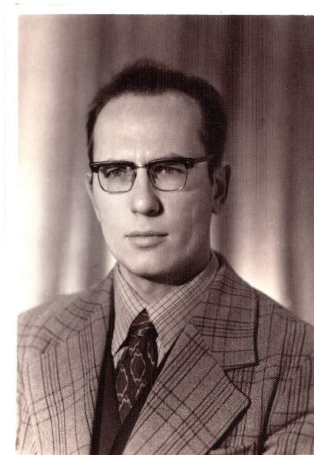
Ректор МТИ (1979–1986 гг.)