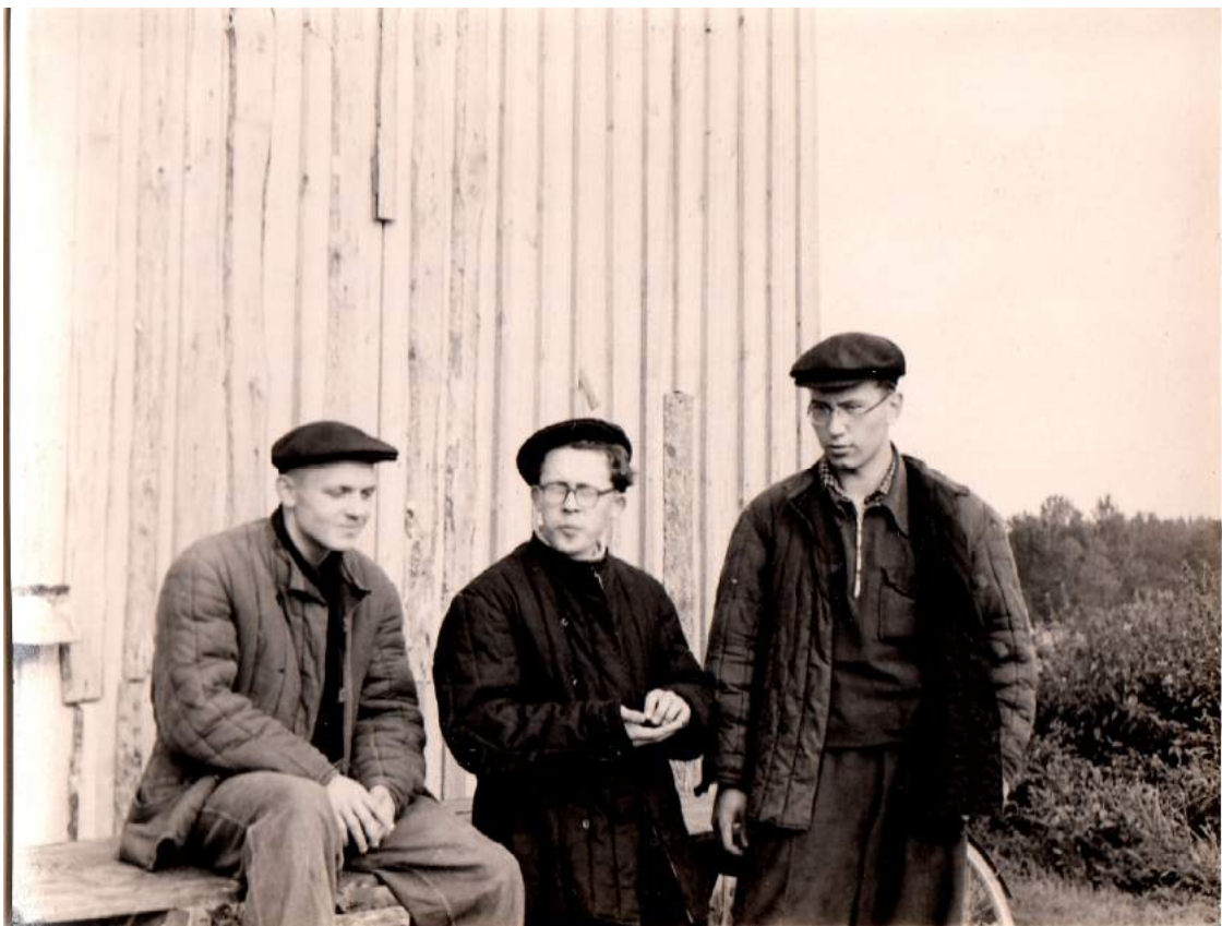
Студент химического факультета ЛГУ – отдых на осенних сельхозработах (1955 г.)