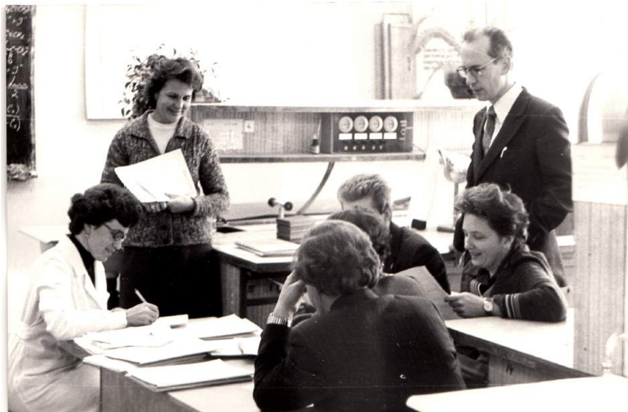
Обсуждение в лаборатории кафедры химии МТИ итогов студенческих научных работ (1982 г.)