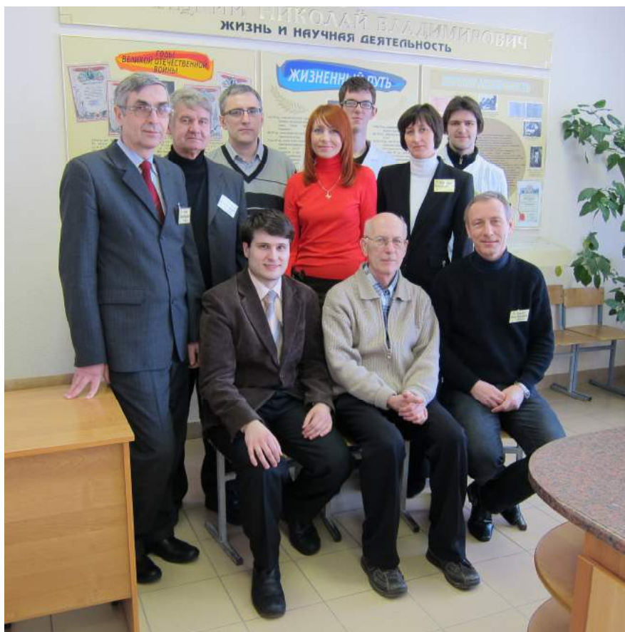
С организаторами Республиканской олимпиады по химии (2013 г.)