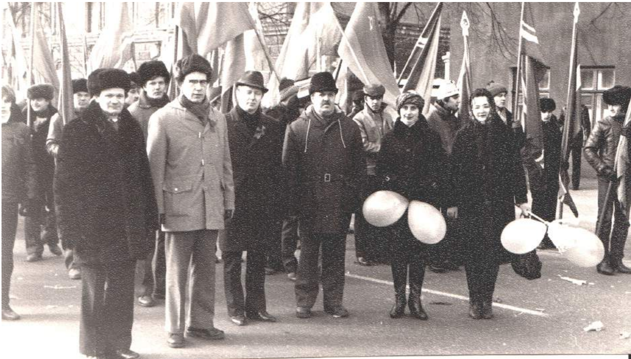
На праздничной демонстрации