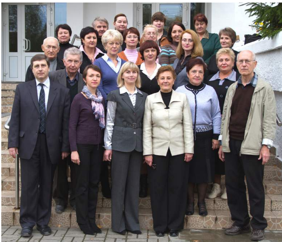
Кафедра химии (2012 г.)