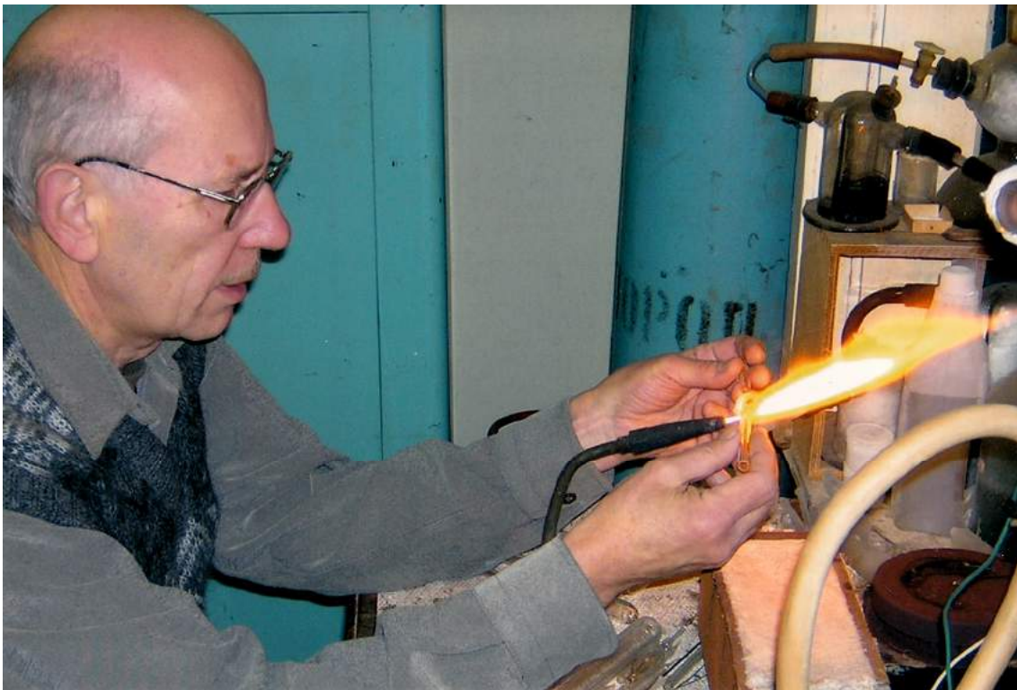
В лаборатории (2004 г.)