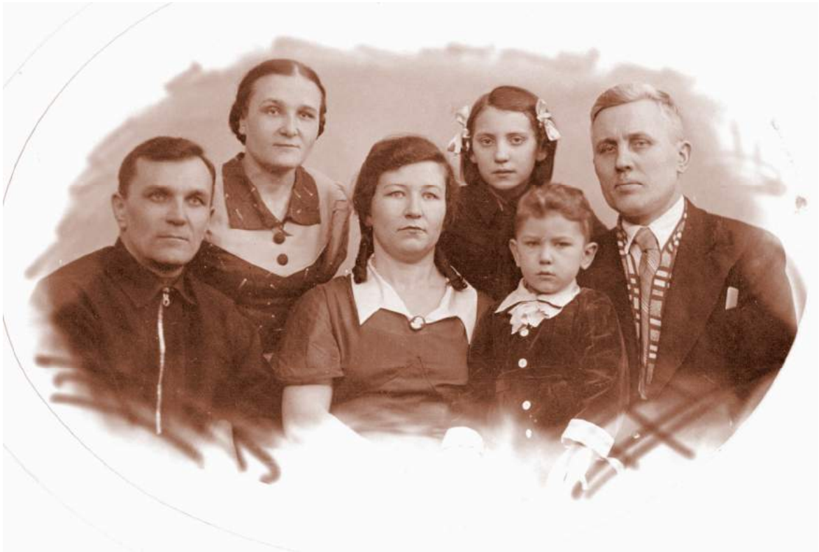
С родителями, сестрой, тётёй и дядей (1940 г.)