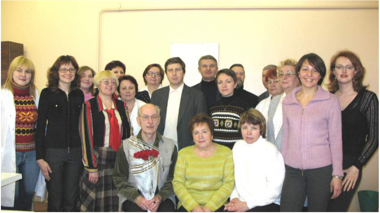
Празднование юбилея на кафедре (2006 г.)