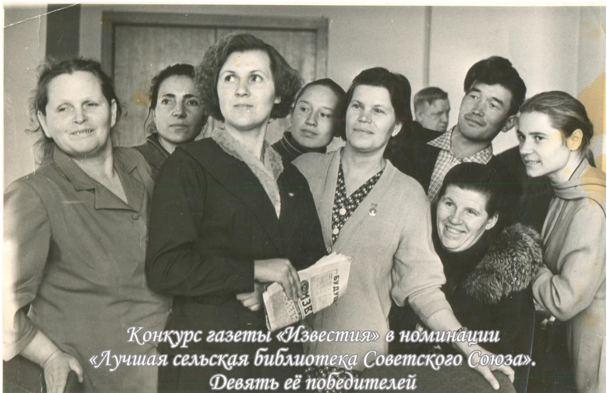
В первом ряду третья

Награждена Почетными грамотами: «К 40-летию Великого Октября», «К 50-летию Великого Октября», «За активную работу по коммунистическому воспитанию трудящихся», «За многолетнюю и плодотворную работу в области культуры», «За высокие показатели в социалистическом соревновании», «По итогам выполнения социалистических обязательств» и др.