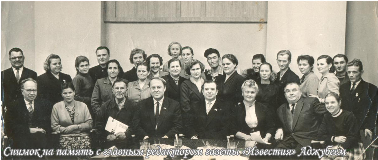
В первом ряду вторая слева