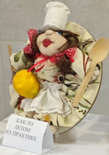
КАК-ТО ЛЕТОМ НА ПРАКТИКЕ