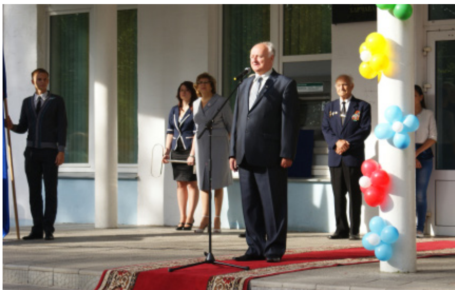
Ректор МГУП В.А. Шаршунов

Жизнь каждого человека похожа на огромную открытую книгу, потому что каждый новый год начинается с новой страницы.