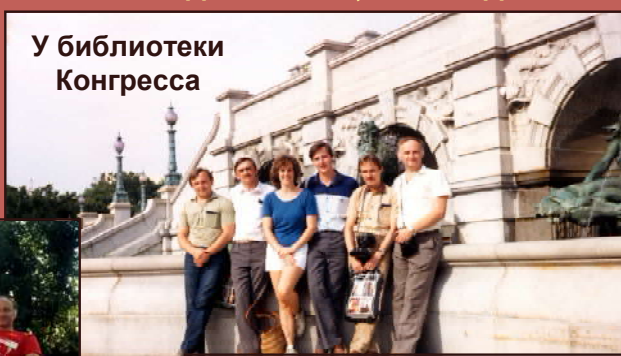
У библиотеки Конгресса