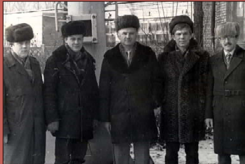
Заведующий кафедрой механизации животноводства БСХА 1984-1992 годы