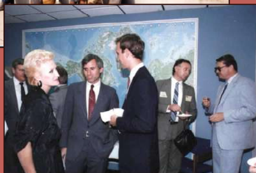
В департаменте сельского хозяйства